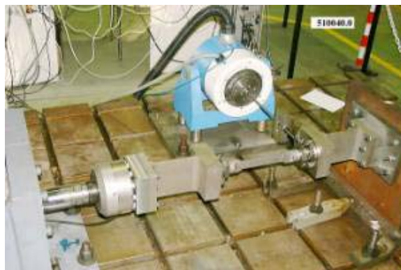
Figura 3. fotografía del montaje completo.

Se pueda apreciar en la figura 3 el montaje completo situado en la bancada.